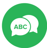
Bevordering van het taalgebruik

Op onze school zijn de volgende vakleerkrachten aanwezig: